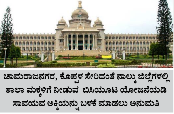
ಚಾಮರಾಜನಗರ, ಕೊಪ್ಪಳ ಸೇರಿದಂತೆ ನಾಲ್ಕು ಜಿಲ್ಲೆಗಳಲ್ಲಿ ಶಾಲಾ ಮಕ್ಕಳಿಗೆ ನೀಡುವ ಬಿಸಿಯೂಟ ಯೋಜನೆಯಡಿ ಸಾವಯವ ಅಕ್ಕಿಯನ್ನು ಬಳಕೆ ಮಾಡಲು ಅನುಮತಿ